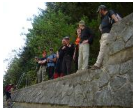
Au col de Bussang