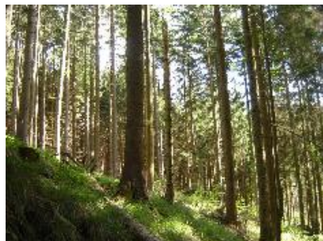
Beautés de la forêt vosgienne