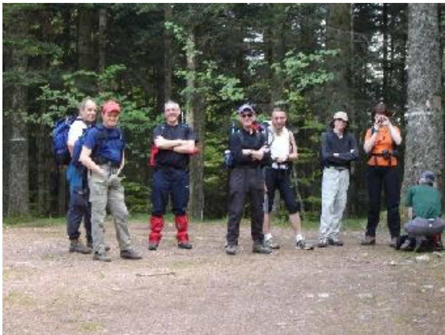
L'équipe en milieu d'après midi