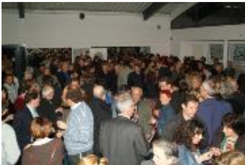
Durant le buffet