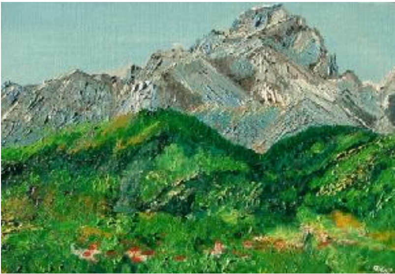
Tableau offert par Chloé à Eric pour son 25ème anniversaire de greffe en remerciements pour l'avoir guidée au sommet de l'Obiou en 2005 .