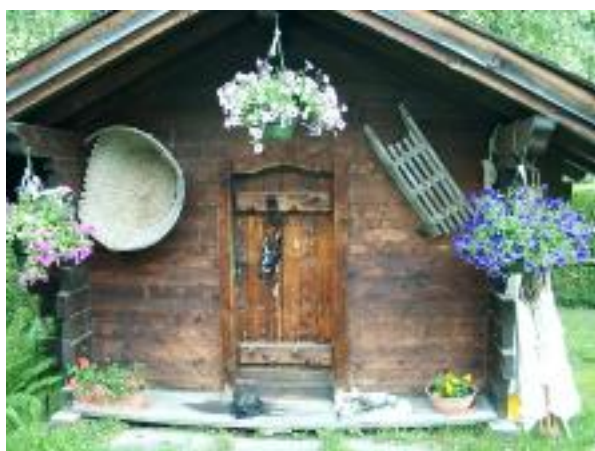
Le chalet 4 places - PC médical