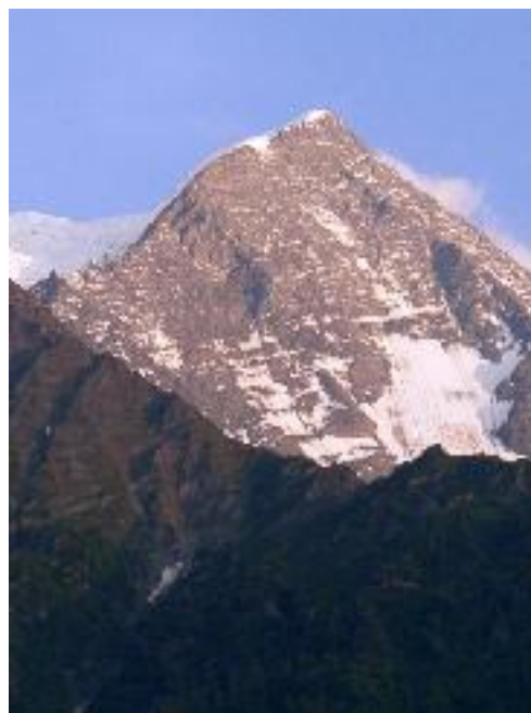
Vue sur l'Aiguille du Goûter - 3817m – depuis chez Chacha