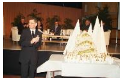
Un gâteau à la hauteur de l'événement