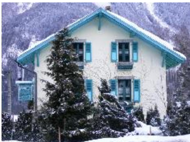
Le gîte, bâtiment principal, 20 places