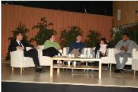
Autour des défis en tennis de table

Lors de cette soirée, une séance de dédicace a eu lieu durant le cocktail.