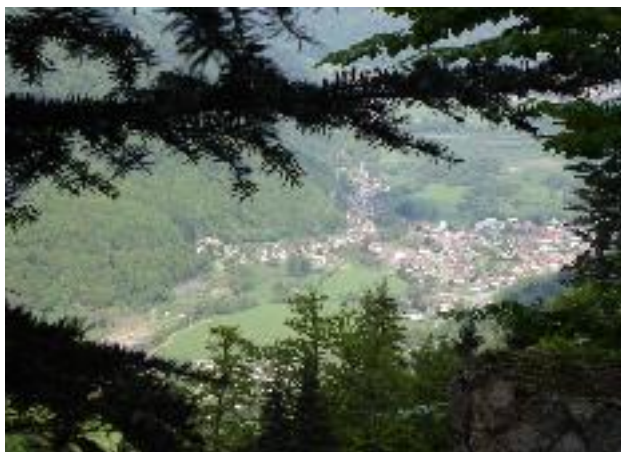
Vues sur l'Alsace