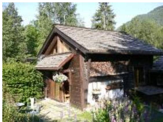
Le chalet 6 places - PC Presse et Organisation