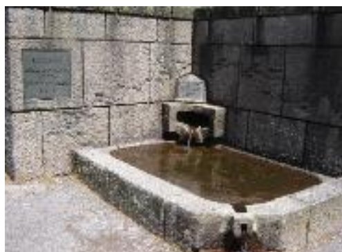
Source de la Moselle