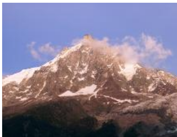
Vues sur l'Aiguille du Midi—3842m—depuis chez Chacha