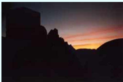
Refuge Vallot et Sommet du Mt Blanc