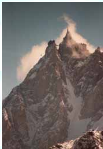
Aiguille du Midi

Jeudi 22 juin : Arrivée au gîte "La Crèmerie du Glacier" aux Bossons au plus tard à 16h00.