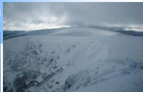
Rendez-vous en page 6

hender en fin de stage des couloirs de neige assez raides, de connaître les bases de sécurité essentielles à un minimum d'autonomie en haute montagne, de tester son matériel et de faire le point sur son niveau physique.